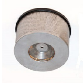
Upstream HEPA Filter - Included