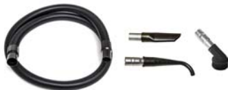
Static Conductive Suction Hose and Tool Kit - Included