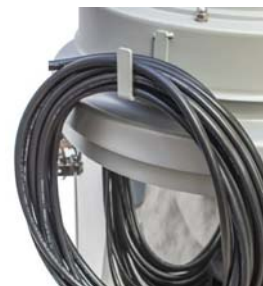
Cable Holder Hook included on the side of the powerhead